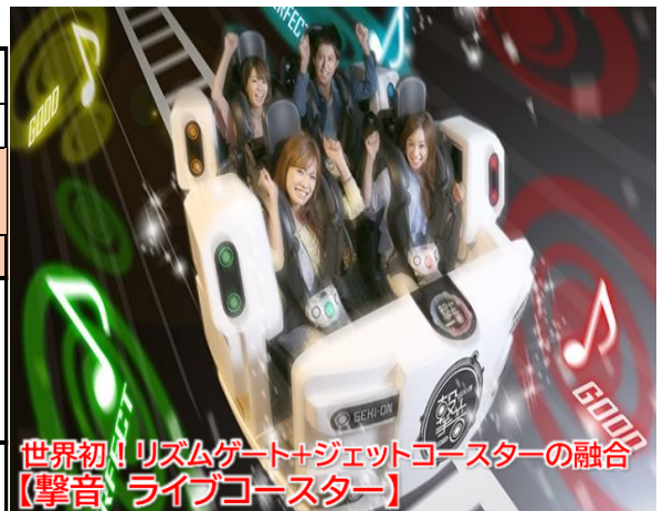
世界初!リズムゲート+ジェットコースターの融合 【撃音 ライブコースター】

●最少催行人員:15名 ●添乗員:同行致します ●食事:朝 2回 ●航空会社:スカイマーク ●利用バス会社:共同観光バス または なの花交通