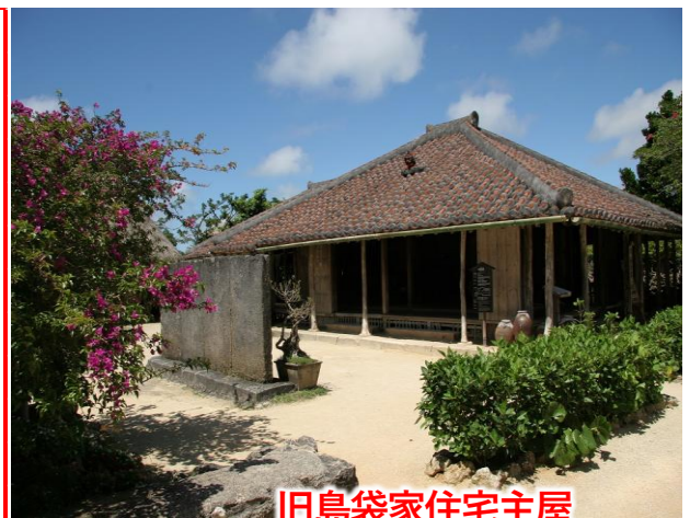
旧島袋家住宅主屋