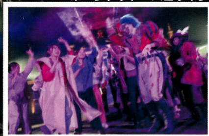
ホーンテッド・ハロウィン