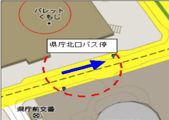
パレットくもじ前 (県庁北口バス停)