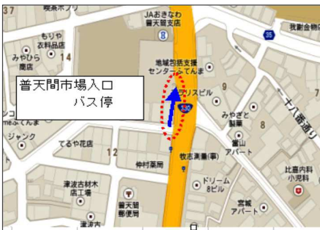
普天間市場入口バス停