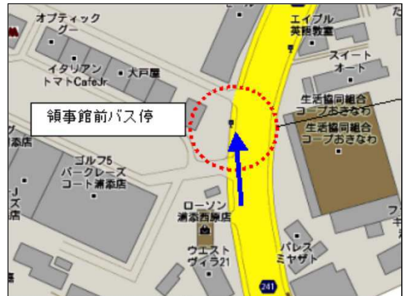
領事館前バス停 (パークレースコート)